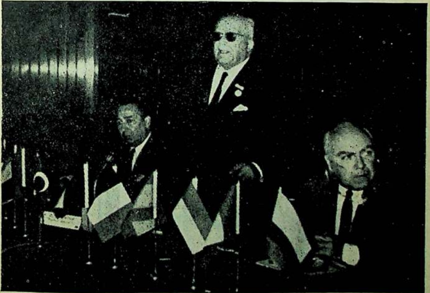
Toplantıda açılış konuşmasını yapan Başbakanlık Müsteşarı Munis F. Ozansoy ve Birlik İdare Heyeti.

Daha sonra seçimlere geçilmiş, eski İdare Heyeti aynen seçilerek Birliđin 6. cı Genel Kurul toplantısının 1970 yılında Milânoda yapılması karar altına alınmıştır.